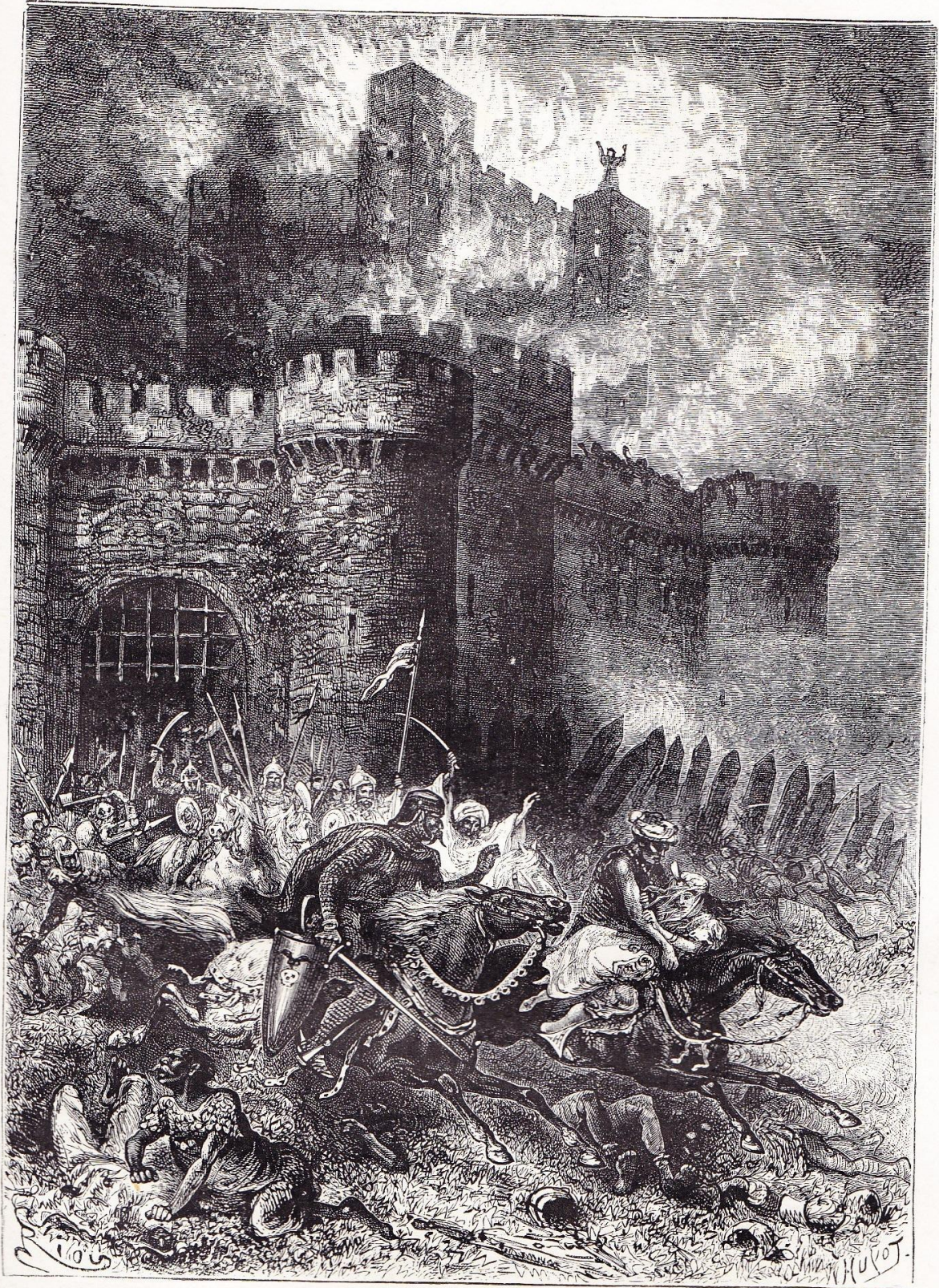
Enlèvement de Rébecca pendant l'incendie de Torquilstone.